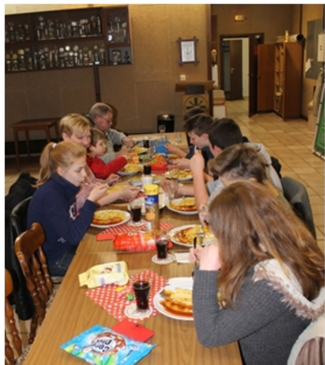
Eine Stärkung für alle

sprechen. Eine Spende, von einem der nicht genannt werden wollte, trug dazu bei, dass kaum Geld aus der Jugendkasse benötigt wurde. Den Gesichtern der Jugendlichen konnte man entnehmen, dass es ein gelungener Nachmittag war.